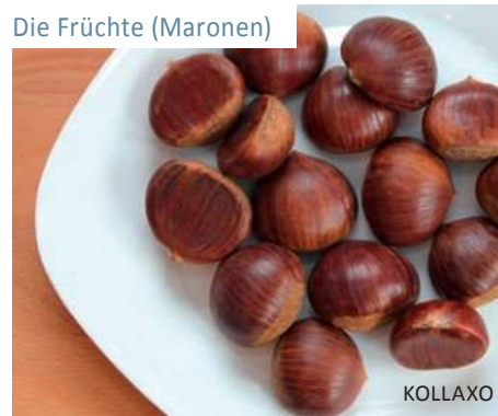
Die Früchte (Maronen)