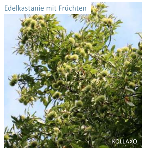
Edelkastanie mit Früchten

Bereits Karl der Große ordnete in der „Reichsgüterverordnung“ das Pflanzen von Kastanienbäumen in den königlichen Pfalzen an. Mit einem Stärkeanteil von 43 Prozent waren die Kastanien wichtiger Bestandteil der Armenkost, um bei Missernten das Überleben der notleidenden Bevölkerung zu sichern. Im Laufe der Zeit wurden zahlreiche Sorten der Edelkastanie gezüchtet, die zu unterschiedlichen Zeitpunkten reif wurden, sodass über einen langen Zeitraum Kastanien zum Verzehr, als Tierfutter oder zur Mehlherstellung