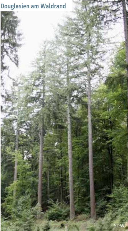
Douglasien am Waldrand

die in jungen Jahren olivgrün aussieht und mit Harzblasen übersät ist, bekommt im Alter einen sehr dunklen rotbraunen bis grauschwarzen Farbton und tiefe Risse. Die zwei bis drei Zentimeter langen, weichen Nadeln sind stumpf und besitzen auf der Unterseite zwei weiße Streifen. Werden sie zerrieben, lässt sich ein aromatischer Geruch wahrnehmen, der an Orangen erinnert. Die Douglasie ist fachlich ausgedrückt „einhäusig getrenntgeschlechtig“, was bedeutet, dass sowohl weibliche als auch männliche Blüten auf einem Baum vorkommen. Sie blüht zwischen April und Mai. Die fünf bis acht Zentimeter langen, eierförmigen Zapfen des Baumes, die zum Boden zeigen, fallen durch ihre weit herausragenden dreispitzigen Deckschuppen auf. Die fünf bis sechs Millimeter langen Flügelsamen, die bis September reifen, fliegen von Oktober bis November durch die Landschaft.